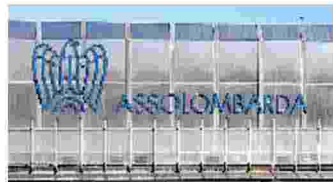
VIA PANTANO Sede di Assolombarda